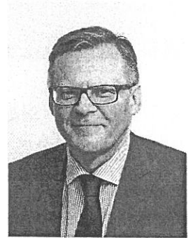
PREZES KASY ROLNICZEGO UBEZPIECZENIA SPOŁECZNEGO