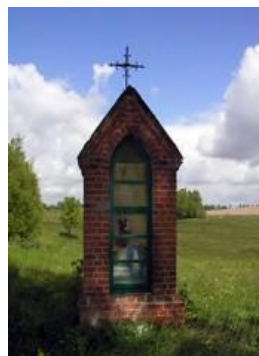
Kapliczka neogotycka , przy drodze do wsi. Jednokondygnacyjna z niszą przeszkloną z figurą Matki Boskiej. Daszek dwuspadowy kryty dachówką i zwieńczony metalowym krzyżem.