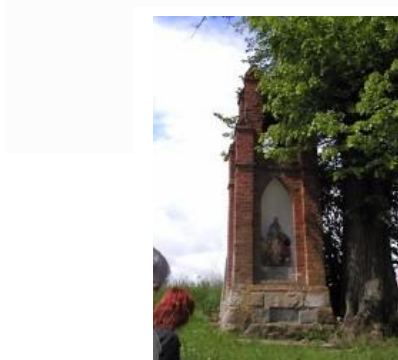
Kapliczka neogotycka , dwukondygnacyjna, w dolnej niszy z figurą Matki Boskiej. Kapliczka na podmurówce z kamienia polnego zakończona sterczynkami. Usytuowana przy drodze do wsi.