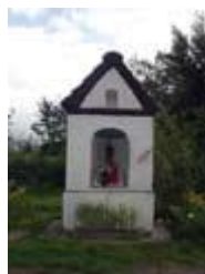
Kapliczka przydrożna, neoklasycystyczna, p.w. św. Floriana.

We Franknowie znajdują się także cztery neoklasycystyczne kapliczki.