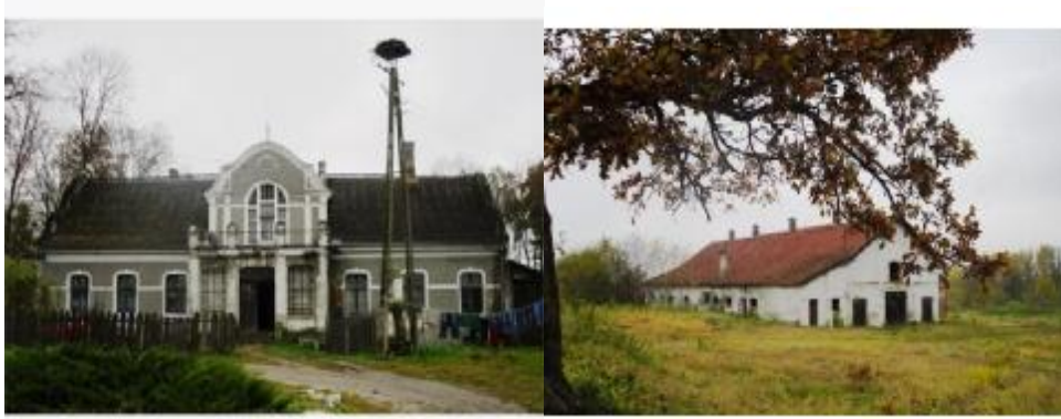
Dwór secesyjny z parkiem pocz. XX wieku