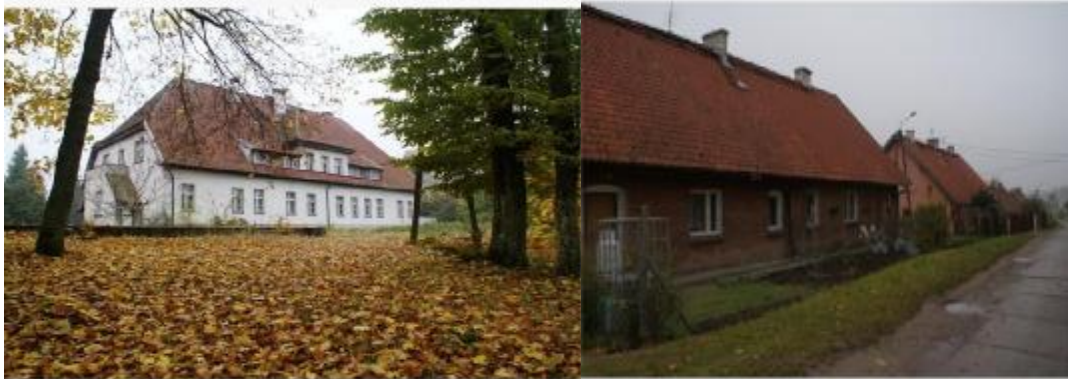
Pałac z pocz. XX wieku

We wsi Wójtówko zarejestrowanych jest 18 obiektów zabytkowych. Świetnie zachowany jest nie tylko pałac, ale też niemal kompletne zabudowania gospodarcze. Pałacyk wzniesiono w początkach XX wieku, na planie prostokąta. Jest to budowla jednokondygnacyjna, pokryta dachem naczółkowym, z wystawkami od frontu i elewacji tylnej. W elewacji frontowej drobno przeszklony ganek z wysokimi schodami, od strony parku duża weranda.