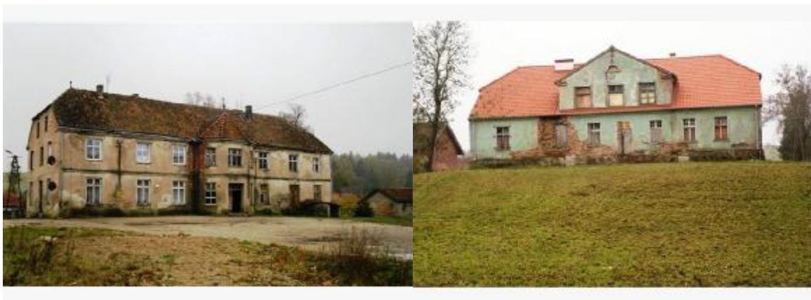
Dwór z XX w.

Dwór z XIX w. murowany z cegły, otynkowany. Dwukondygnacyjny, podpiwniczony z użytkowym poddaszem, siedmioosiowy. W środkowej części elewacji frontowej dwukondygnacyjny ryzalit kryty pięciospadowym dachem zakończonym iglicą. Dach budynku dwuspadowy z naszczytnikami kryty dachówką.