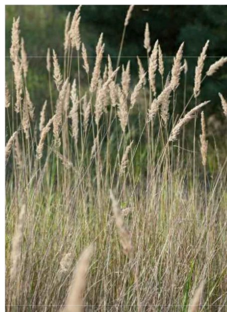
Calamagrostis epigejos trzcinnik piaskowy