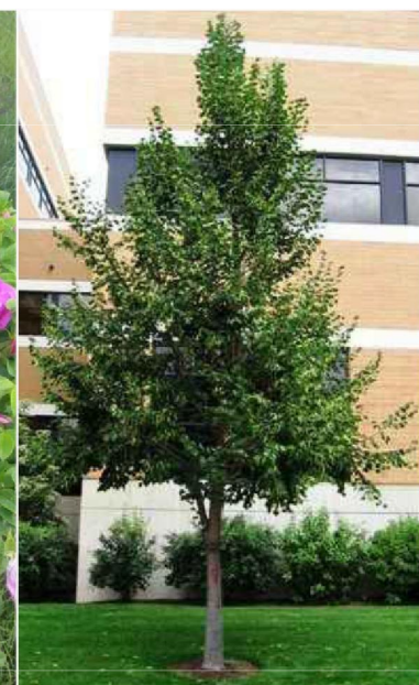
Tilia cordata 'Greenspire' lipa drobnolistna 'Greenspire'