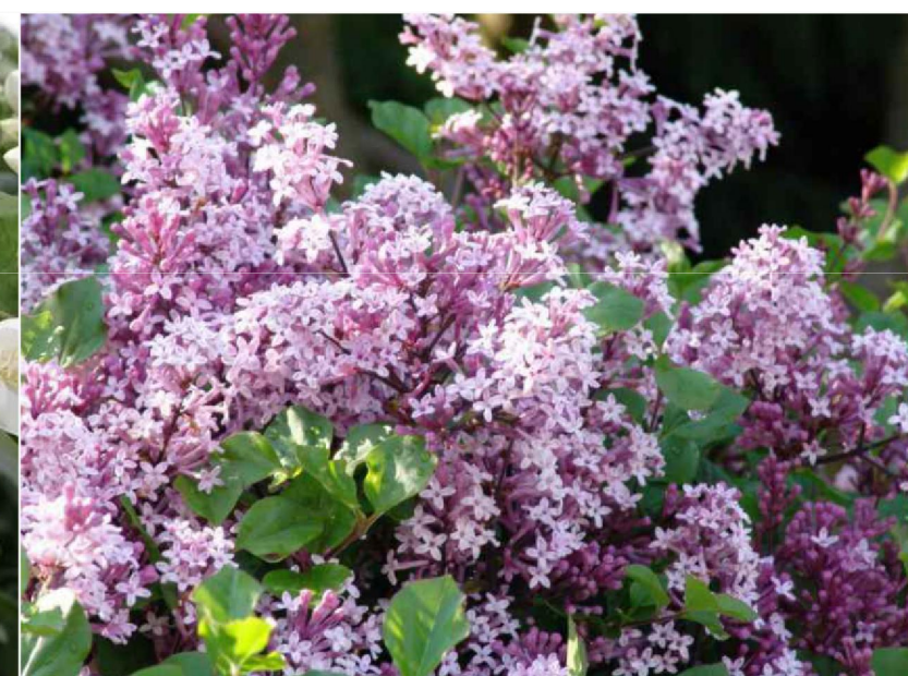
Syringa meyeri 'Pablin' lilak Meyera 'Pablin'