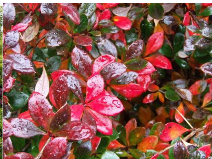
Berberis x media 'Red Jewel' berberys pośredni 'Red Jewel'