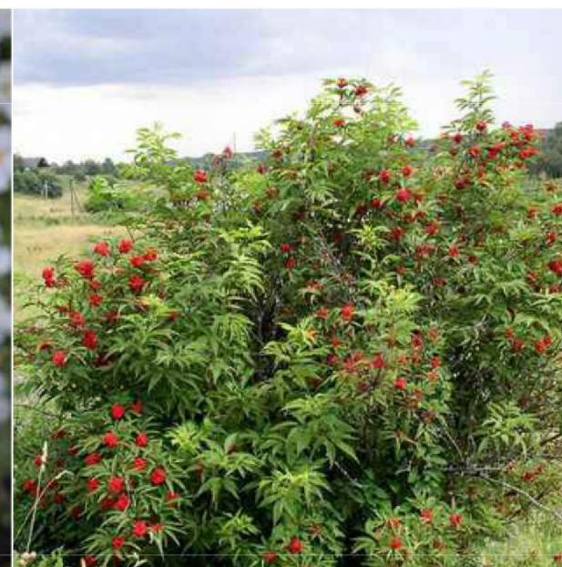
Sambucus racemosa bez koralowy