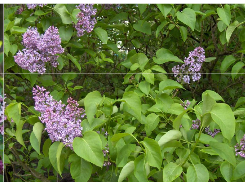
Syringa vulgaris lilak pospolity

Uwaga: Rozpatrywać łącznie z opracowaniami branżowymi.