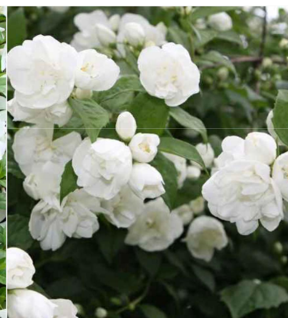
Philadelphus hybrida 'Girandole' jaśminowiec mieszańcowy 'Girandole'