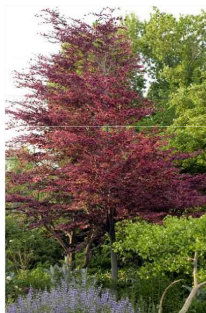
Fagus sylvatica 'Purpurea tricolor' buk pospolity 'Purpurea tricolor'