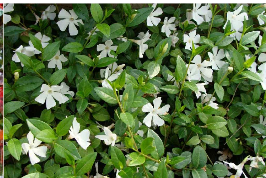
Vinca minor 'Alba' barwinek pospolity