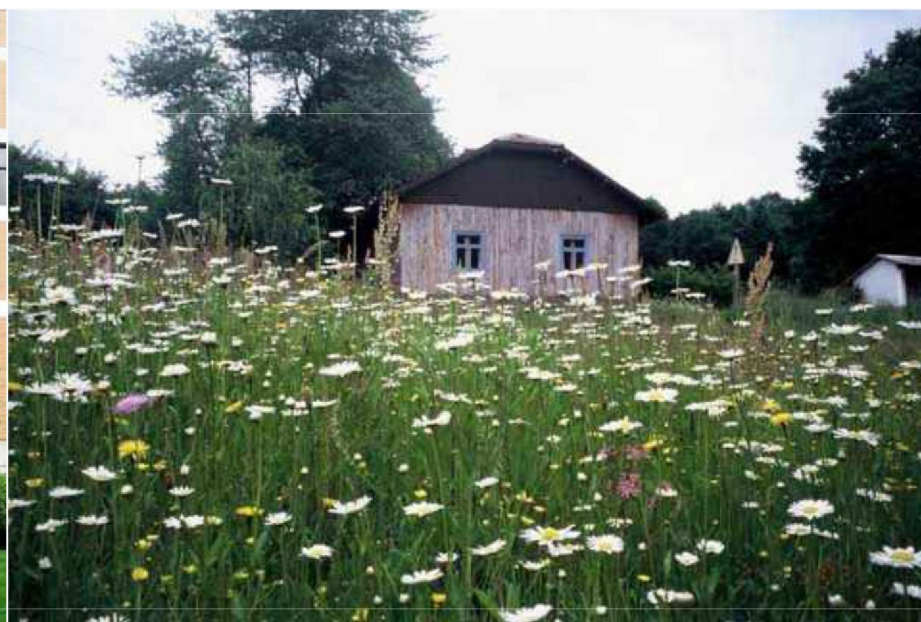
łąka kwietna mieszanka POLSKA ŁĄKA KWIETNA