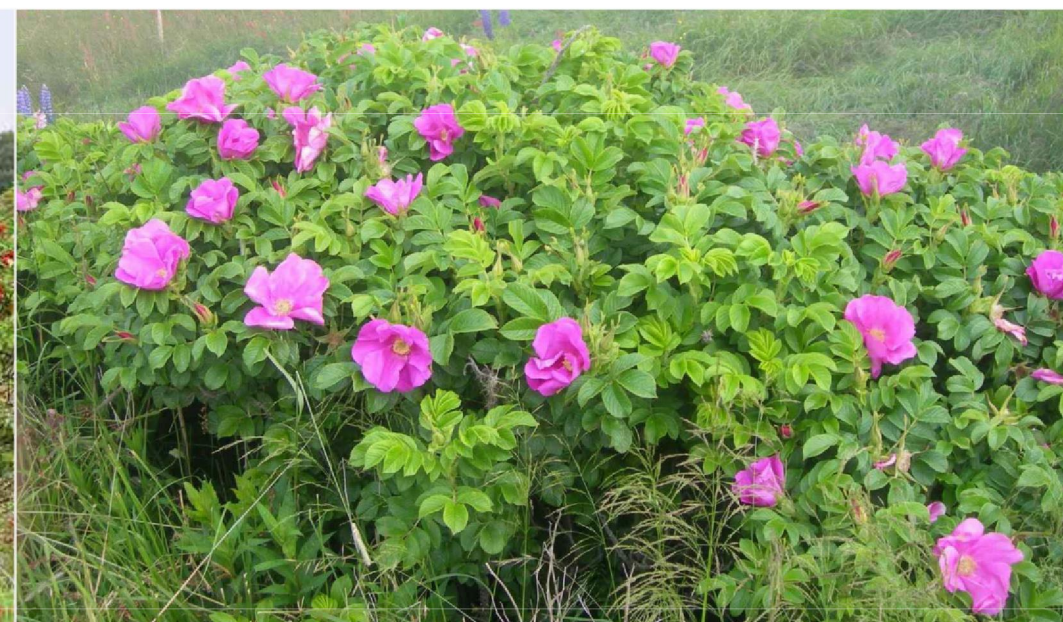
Rosa rugosa róża pomarszczona